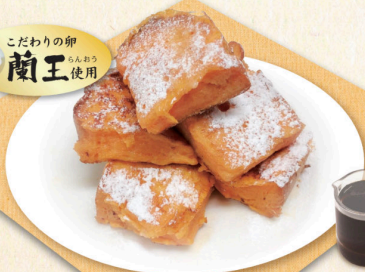
※黄金のフレンチトースト※