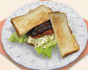
※チキンカツサンド※